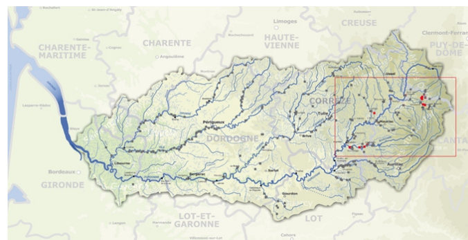
Bassin de la Dordogne et localisation des ouvrages en renouvellement